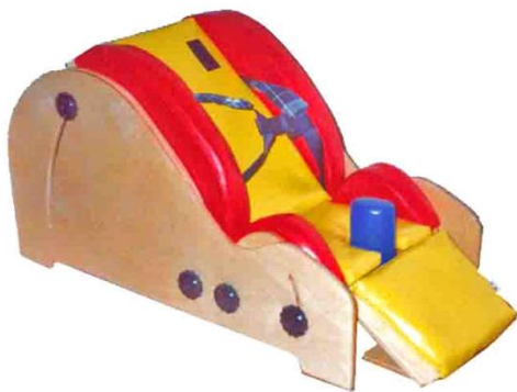
Опора для сидения лежания для детей с ДЦП