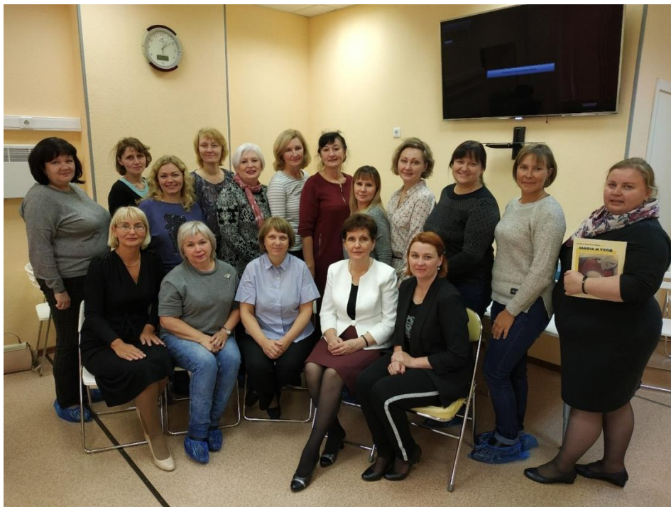
Стажировки в Санкт-Петербургском Институте раннего вмешательства