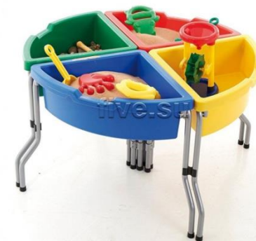
Центр для воды и песка