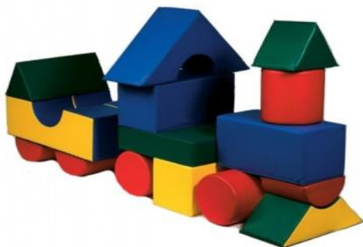
Мягкие строительные модули